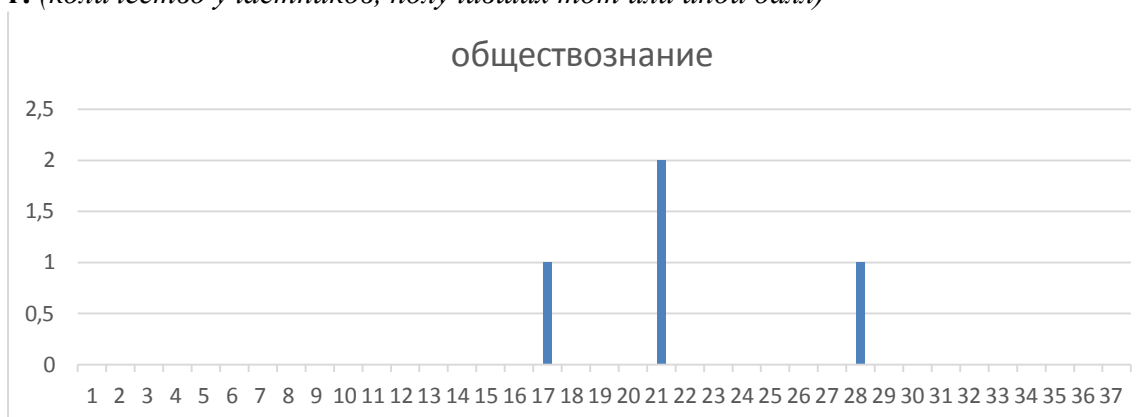
Диаграмма распределения первичных баллов участников ОГЭ по предмету в 2023 г. (количество участников, получивших тот или иной балл)